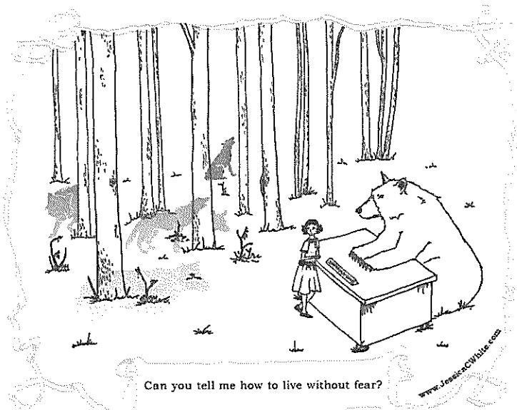
“Kannst du mir sagen, wie es geht ohne Angst zu leben?”